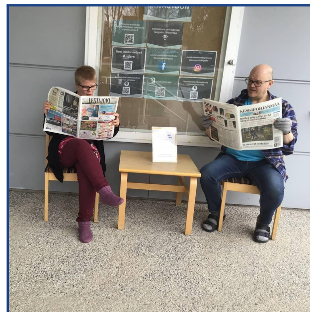
Kuva: Lehtisalin ollessa suljettuna päivän lehdet sai lukea ulkona, kahden hengen "lehtisalissa".

Kesäkuun ensimmäisenä päivänä kirjasto saatiin vihdoinkin avata asiakkaille rajoitetuin palveluin ja turvajärjestelyin. Kirjaston lainaustiskille asennettiin suojaplexi, turvaväleistä muistutettiin esimerkiksi lattiassa olevilla turvavälitarroilla ja asiakkaita myös ohjeistettiin nopeaan asiointiin. Kalusteita karsittiin kirjaston tiloista, pelihuone pysyi suljettuna ja iPadit sekä kahviautomaatti otettiin pois käytöstä. Myös osa asiakaskoneista otettiin pois käytöstä, jotta turvavälit saatiin varmistettua. Laina-automaatin käyttöä suositeltiin.